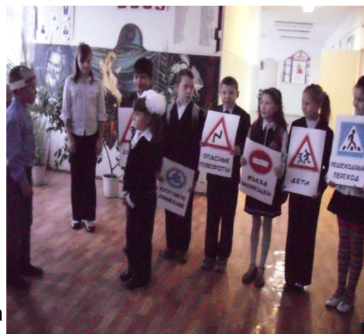
Выступление учащихся 1 –4 классов на общешкольной линейке

Сами мы были и инспекторами, и знаками, и хулиганами. А завершилось наше выступление игрой, в которой ребята из начальной школы были водителями и пешеходами. Они учились вести себя на дороге в соответствии со знаками,